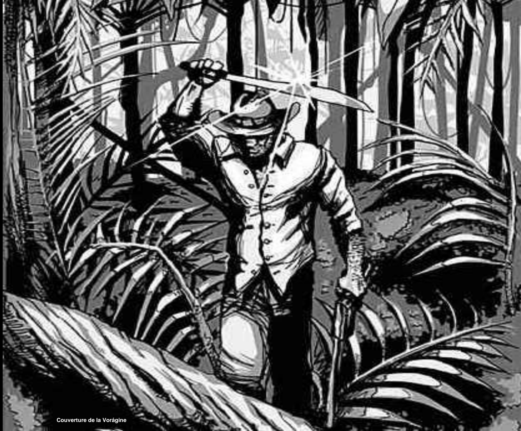
Couverture de la Voragine