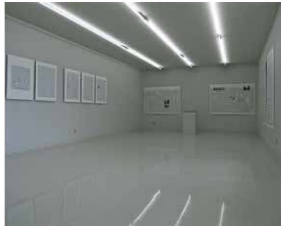
Calendriers , Cneai, 2014 (exposition personnelle). Kalendarze , Cneai, 2014 (wystawa indywidualna).

żył w Nowym Jorku galerię sztuki nowoczesnej, Siegelaub odgrywał wówczas zarazem kluczową rolę w krytyce wystawy.