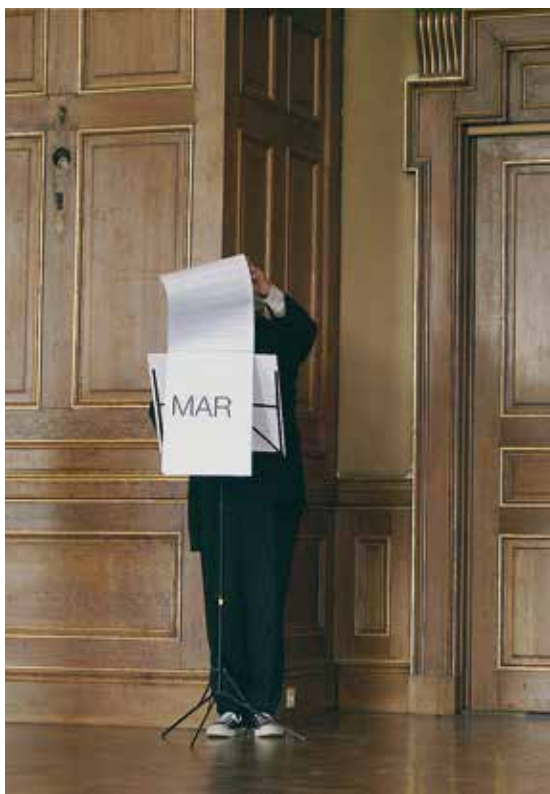
Lecture exposition #20, Cité universitaire, Paris, 28 juin 2009. Lektura wystawa #20, Cité universitaire, Paryż, 28 czerwca 2009.