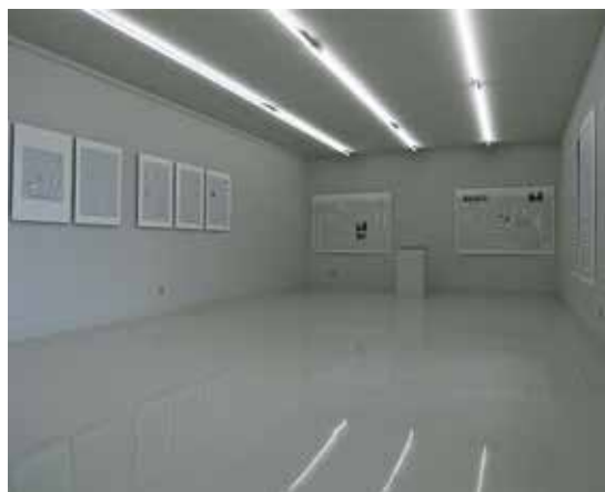
Calendriers , Cneai, 2014 (exposition personnelle). Kalendarze , Cneai, 2014 (wystawa indywidualna).

żył w Nowym Jorku galerię sztuki nowoczesnej, Siegelaub odgrywał wówczas zarazem kluczową rolę w krytyce wystawy.