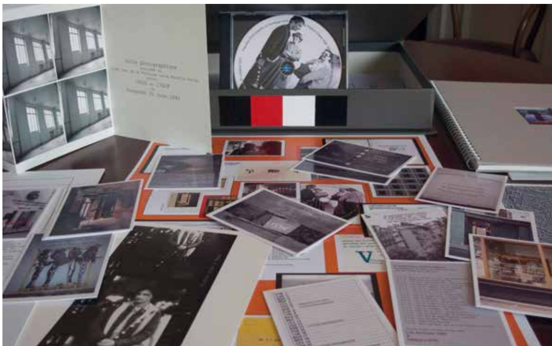
Contenu boîte Cadere NRBN, 2004. Zawartość pudełka Cadere NRBN, 2004.