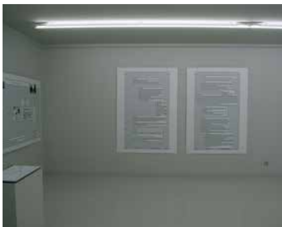
Calendriers, Cneai, 2014 (exposition personnelle). Kalendarze, Cneai, 2014 (wystawa indywidualna).