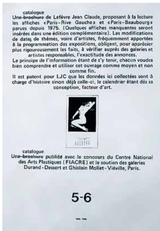
Couverture catalogue 5-6 (brochure 1984-1985). Okładka katalogu 5-6 (broszura 1984-1985).