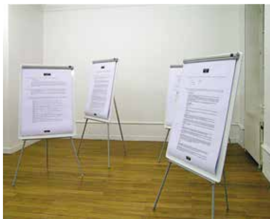
Exposition interface, rutault/lefevre, Dijon, avril 2012. Wystawa interfejs, rutault/lefevre, Dijon, kwiecień 2012.

ślady. Podpisałaby się pod tym postulatem spora część myślicieli w historii filozofii, gdy tymczasem rzeczywistość sprowadza najczęściej artystę do schematycznego powielania pewnego typu form i przedmiotów; nawet jeśli ewoluują one w czasie i nawet jeśli pozycja artysty w historii sztuki łączy się najczęściej z innowacjami formalnymi. Aby uznać dzieło za proces myślenia, nie wystarczy ograniczyć procesu twórczego do koncepcji i przekazać rzemieślnikom czy przemysłowi realizację samego przedmiotu, jak czynili to artyści związani z minimal artem. Myślenie jest bowiem wymagającą, codzienną dyscypliną, a „materialny przedmiot”, notuje Lefevre Jean Claude 25 czerwca 1995 roku, „jest znakiem, resztkowym śladem niepowodzenia w łańcuchu refleksyjnym, mającym doprowadzić do możliwej jego »prezentacji«.” 4