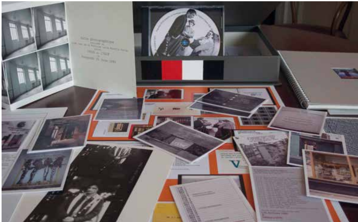
Contenu boîte Cadere NRBN, 2004. Zawartość pudełka Cadere NRBN, 2004.

dział-przedmiotów, które można potem przedstawiać do jakiegokolwiek innej sali wystawowej. Sztuka Lefevre Jean Claude'a od samego początku poddaje krytyce taką koncepcję dzieła sztuki; wszelkie jego interwencje jako artysty są pomyślane i realizowane jako jednorazowa i niepowtarzalna odpowiedź (nawet jeśli idzie o druk w setkach egzemplarzy) na szeroko pojęty kontekst, w którym dzieło ma być prezentowane (kontekst kulturalny, instytucjonalny, przestrzenny, językowy itd.). „Śmiesznym byłoby buntować się albo być rozczarowanym w wieczór 101-go wernisażu,” odpowiada Morellet, który przez lat trzydzieści był równocześnie artystą i szefem przedsiębiorstwa przemysłowego. Ale konformizmowi temu towarzyszy trzeźwa autorefleksja. Nie tylko minimalizuje on rolę wystawy w karierze artystów, ale sugeruje, że „w systemie współczesnej sztuki,” wystawa jest formalnością „w całym procesie, którego nigdy naprawdę nie przeanalizowano.” Inaczej mówiąc, sztuka jest rzeczywistością społeczną, kulturową, a może nawet polityczną, której nie zaczęto jeszcze w szczegółach opisywać. Do czego prowokuje nas sztuka? Do jakich wypowiedzi, odczuć, analiz i działań? Co się wydarza