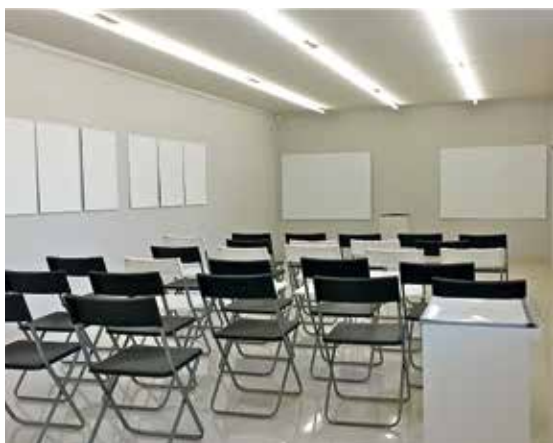
Lecture contre exposition , Cneai, 14 septembre 2014. Lektura przeciw wystawie , Cneai, 14 września 2014.