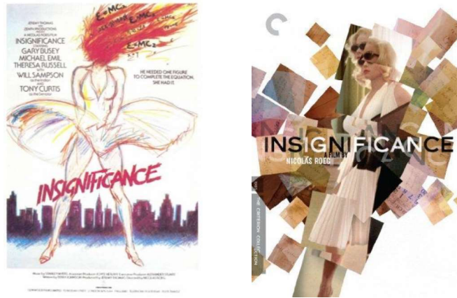
Figure 1 et 2 : Affiches de Une nuit de réflexion (Insignificance)

Ces deux affiches puisent leur source, sur deux registres ou dans deux directions différentes, dans la séquence finale du film, au cours de laquelle la chambre d'hôtel se volatilise dans une explosion que l'on peut rapporter à celle de la bombe atomique, dont on a parfois voulu croire que les théories d'Einstein avaient rendu possible la mise en œuvre. Au cours de ce long passage donné à voir majoritairement au ralenti, les deux protagonistes brûlent, mais de façon très singulière. Ils n'y figurent pas tant, en effet, à l'état de futurs cadavres, c'est-à-dire comme des personnages incarnés en voie de dissolution, mais plutôt comme des figurines de papier, effigies en deux dimensions dont un traitement visuel particulier désigne sans ambiguïté la nature. Ainsi ce n'est pas le corps de Marilyn Monroe qui brûle dans cette chambre d'hôtel fictive, mais d'emblée la fiction de ce corps, un être d'image dont le cinéaste avait explicitement dénoncé la nature au début de la séquence [Figure 3], ce qui lui permettra in fine de faire revenir l'Actrice et le Professeur, en un dernier plan invalidant le ravage de la chambre, comme s'il ne s'était rien passé. Car au fond, et c'est la leçon de ce film, rien ne peut vraiment détruire une image.