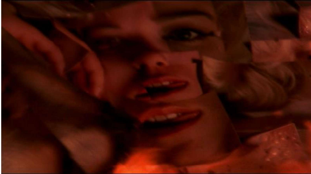
Figure 3 : Une nuit de réflexion