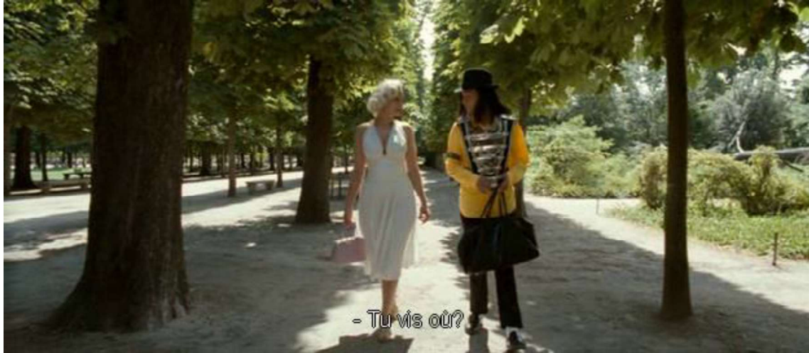
Figure 4 : Mister Lonely

Monde 17 . Ainsi Marilyn Monroe n'y figure plus un inaccessible objet du désir, mais une mère et une épouse, aimante et simple, n'était son accoutrement identique à celui d' Une nuit de réflexion .