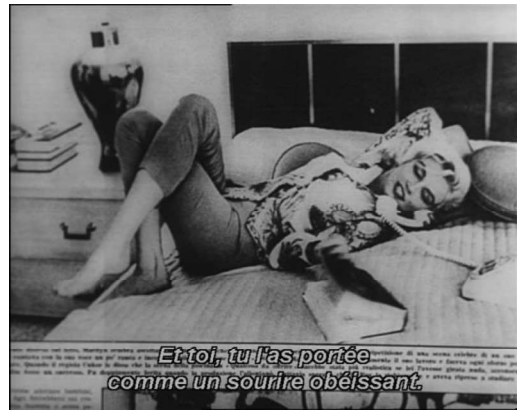
Figure 5 et 6 : La Rabbia