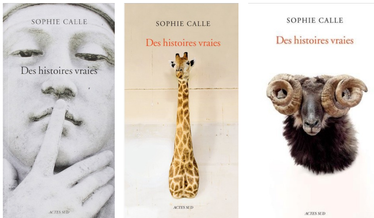
Fig. 2 Des Histoires vraies, 2013, 2016, 2018.