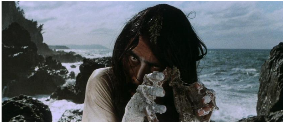
Fig. 3a, 3b : Horrors of Malformed Men (Teruo Ishii, 1969)

Si, par la suite, Hijikata évolue de façon relativement plus conventionnelle dans le récit dont il endosse le rôle de l'antagoniste, sa silhouette sinieuse et dégingandée, ses gestes emphatiques et saccadés, son regard insaisissable et la façon décousue qu'il a d'énoncer son texte l'imposent comme une attraction au cœur même du plan, jamais en phase avec les autres acteurs. Déjà soulignée par la post-synchronisation du film qui contribue à désolidariser sa voix caverneuse de son corps 15 , sa nature attractionnelle est plus encore renforcée par un choix de montage symptomatique : alors que le personnage de Jōgorō Komoda n'intervient dans le récit qu'au bout de 49 minutes, sa saynète introductive sur les rochers est une première fois présentée comme un flash mental au début du film, au moment où le héros découvre un dessin de l'île représentant une falaise 16 . De cette façon, Ishii, réalisateur réputé pour ses talents de monteur, affirme d'entrée de jeu la présence du danseur comme une attraction au sein d'un film dont il met à mal les limites diégétiques en accentuant la théâtralité de cette performance qui semble directement adressée au spectateur.