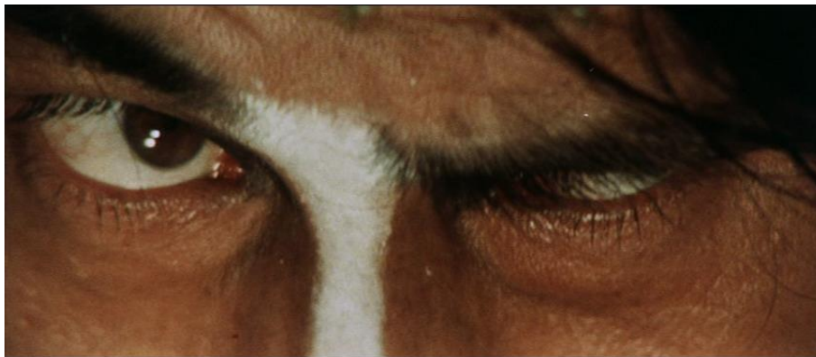
Fig. 6b : Horrors of Malformed Men