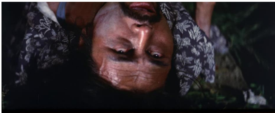
Fig. 5 : Blind Woman's Curse (Teruo Ishii, 1970)

À l'image de cette danse morbide, les attractions empruntées au répertoire de Hijikata pour les films d'Ishii fonctionnent à un double niveau de théâtralité. Selon une théâtralité friedienne 17 , elles s'affirment comme des représentations ouvertement destinées à un public, suivant une « logique exhibitionniste et spectaculaire 18 » qui brise la « clôture narrative et [...] [l']illusion diégétique 19 ». D'un autre côté, la vision d'horreur « quasi charnelle 20 » qu'elles proposent cherche à provoquer « une forme de sidération ou de stupéfaction qui se traduit par une forte implication émotionnelle et physique des spectateurs 21 ». La monstration