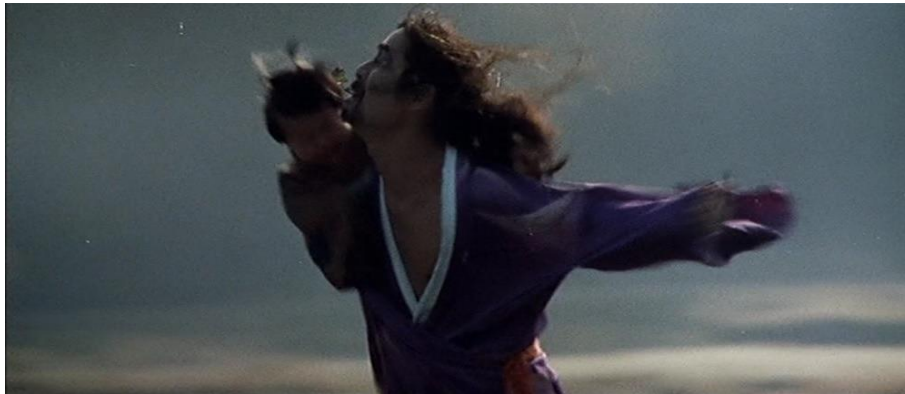
Fig. 1a : Orgies sadiques de l'ère Edo (Teruo Ishii, 1968)

couleur prune et les cheveux en bataille, traverse un champ à vive allure en portant sur son épaule un nourrisson en pleurs, selon un motif emprunté à une série de photographies réalisées par Eikō Hosoe entre 1965 et 1968 dans la campagne de la préfecture d'Akita dont est originaire le danseur ( illustrations 1a et 1b ).