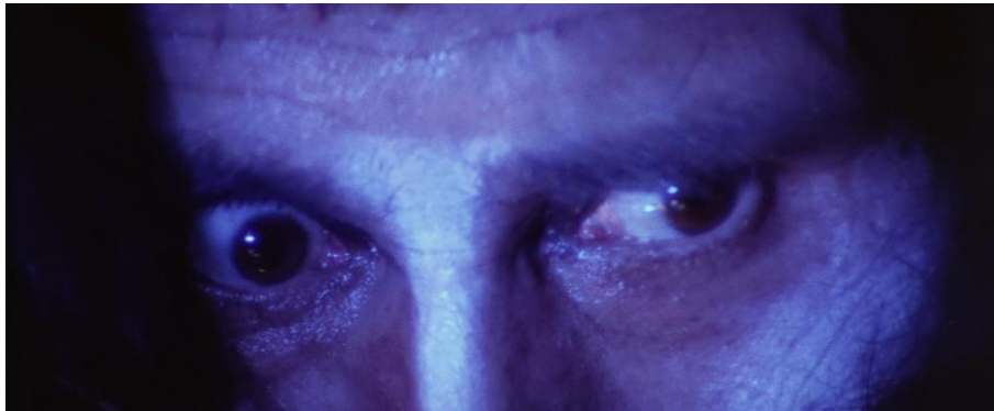
Fig. 6c : Blind Woman's Curse