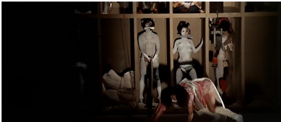
Fig. 2a, 2b : Orgies sadiques de l'ère Edo (Teruo Ishii, 1968)

Si le danseur entretient un rapport aux images en mouvement dès les débuts de l' ankoku butō à l'occasion de collaborations avec des cinéastes expérimentaux, il s'agit ici de sa première incursion dans le cinéma de fiction et celle-ci annonce à ce titre la place que son art et lui vont occuper dans les œuvres suivantes d'Ishii. Certes, le découpage y est de prime abord au service de la captation de l'œuvre scénique, qu'il peut morceler à l'occasion, mais le résultat n'est aucunement comparable à une ciné-danse par exemple. En effet, dans Les Masseurs ( Anma , 1963) ou Rose-Coloured Dance ( Bara iro dansu , 1965), ciné-danses de Takahiko Jimura réalisées à partir de chorégraphies d'Hijikata, la réactivité de la caméra portée