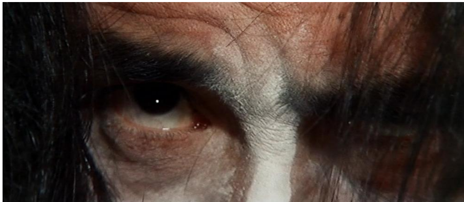
Fig. 6a : Orgies sadiques de l'ère Edo

outrancière des maquillages horribles ou dégoûtants relève alors davantage d'une théâtralité barthesienne, « cette sorte de perception œcuménique des artifices sensuels, gestes, tons, distances, substances, lumières 22 », mais aussi ce « sentiment [...] de la corporéité troublante de l'acteur 23 ». Cette nature double est en quelque sorte annoncée en miroir par les plans introductifs de chacune des apparitions de Hijikata : non pas des gros plans de regards, qui supposeraient une direction orientée vers la réalité diégétique du film et dont l'objet d'attention serait révélé par un contrechamp par exemple, mais des gros plans d'yeux agités de mouvements d'une tension extrême qui témoignent d'un grand trouble intérieur et font ressentir au spectateur la douleur du nerf optique ainsi sollicité, au plus profond de la réalité corporelle du comédien ( illustrations 6a, 6b, 6c ).