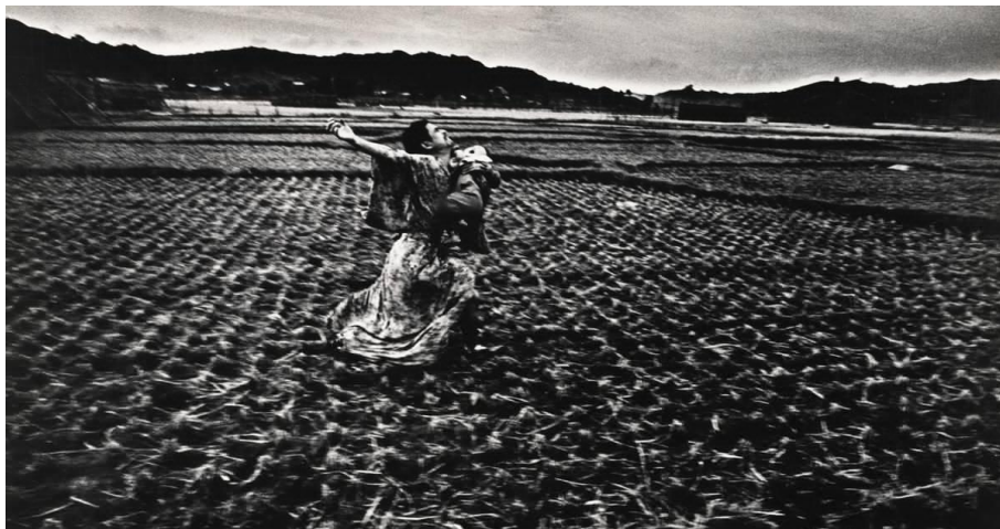
Fig. 1b : Kamaitachi #37 (Eikō Hosoe, 1965)

Passés un arrêt sur image, qui le fige en plein mouvement, et l'apparition du titre du film en lettres écarlates, les yeux de Hijikata surgissent à l'image cadrés en très gros plan. Un zoom arrière révèle alors son visage, en partie masqué par des mèches de cheveux. La lèvre inférieure pendante, une arcade sourcilière en mouvement, le danseur, vêtu cette fois d'un kimono de femme rose pâle, ouvre et ferme une petite boîte contenant ce qui s'apparente à un organe factice transpercé d'aiguilles. Un plan moyen révèle ensuite que l'artiste se trouve à l'intérieur d'une construction en bois comprenant plusieurs « cases », carrées ou rectangulaires, dans lesquelles se tiennent des danseurs d'apparences diverses ainsi qu'un chien. Se suspendant à une corde, Hijikata sort de son emplacement et se précipite dans le vide, suivi par un panoramique vertical, ce qui permet de découvrir la totalité de l'architecture et des individus qui s'y adonnent à d'étranges chorégraphies minimalistes. L'une des danseuses offre par exemple au regard sa poitrine dotée de quatre seins, tandis qu'une autre exécute un mouvement de va-et-vient à califourchon sur une roue de torture. Un ample mouvement de caméra permet d'apprécier davantage la composition d'ensemble installée sur