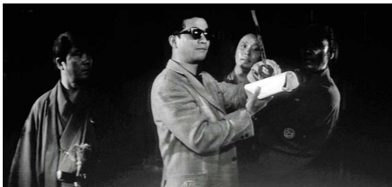
Hideo Gosha sur le tournage du film Trois Samourais hors-la-loi (1964).

4 Robin Gatto oppose ainsi les jidai geki “passéistes et moralistes des années cinquante” à “une incarnation extrême du genre, le zankoku mono ou jidai geki de la cruauté , également relayé par la littérature et le manga”.