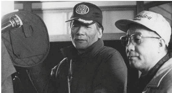
Fujio Morita et Hideo Gosha.

à 1992 sur les treize derniers films de sa carrière. Or, l'esthétique néoclassique de Morita est à mille lieues des effets de zooms et de caméra portée 23 . Ces quelques éléments permettent donc de relativiser l'influence esthétique de certains genres occidentaux sur le chanbara et prouvent que la dimension technique doit être prise en compte chaque fois que l'on souhaite discuter de la circulation de motifs formels d'une cinématographie à l'autre. À ce titre, l'emploi du ralenti dans les scènes d'action constitue un autre exemple évocateur : introduit par Kurosawa dès Rashōmon , employé un temps puis abandonné par Gosha, il est magnifié par un Sam Peckinpah avant d'être repris dans le chanbara des années 1970.