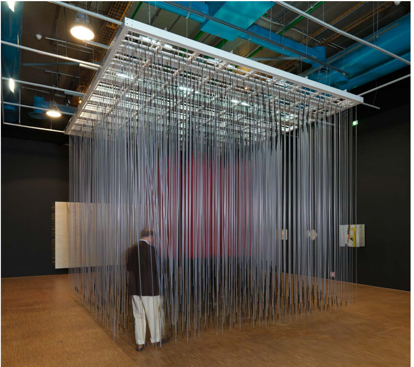
Fig. 2. Jesús-Rafael Soto, Pénétrable , présentation MNAM.

rester fidèles, les différents paramètres d'intervention, suivant les critères bien établis par la déontologie de la discipline que sont la stabilité des matériaux utilisés, leur réversibilité et leur compatibilité avec les matériaux originaux – bref, à établir un cahier des charges, qui convienne aussi bien à l'artiste qu'au musée.