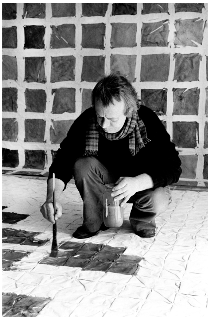
Fig. 1. Portrait du peintre Simon Hantaï, 1972, à Meun, France, 1972.

avait été de dérestauration, les anciennes opérations sur le support effectuées à la demande de l'artiste s'étant avérées dommageables à l'œuvre. Elle en a référé à Hantaï et c'est la prise de conscience par l'artiste d'une fragilité nouvelle, d'une historicité des opérations qu'il avait conçues comme mettant un terme à l'œuvre et en assurant la pérennité, qui a entraîné une attitude plus constructive : la nécessité de dérestaurer imposant de mieux réfléchir le marouflage, ce qui a été fait avec la collaboration du C2RMF et les moyens du laboratoire. Dès lors, de 2004 à 2008, s'est nouée une véritable collaboration entre la restauratrice et l'artiste, aboutissant à formaliser au plus près des intentions de celui-ci, auxquelles dans tous les cas l'institution propriétaire entend