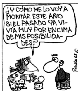
ROMEUI, ELPAIS.com, 04/01/2008