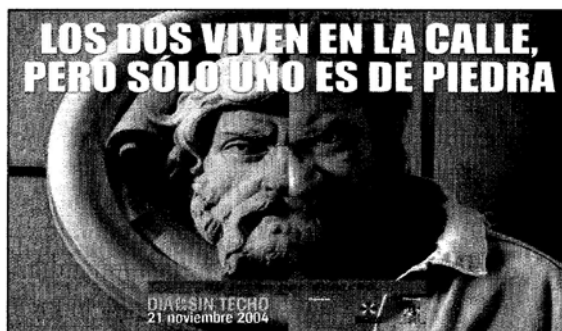
Affiche d'une campagne de l'organisation Caritas, parue en 2004, http://www.caritas.es