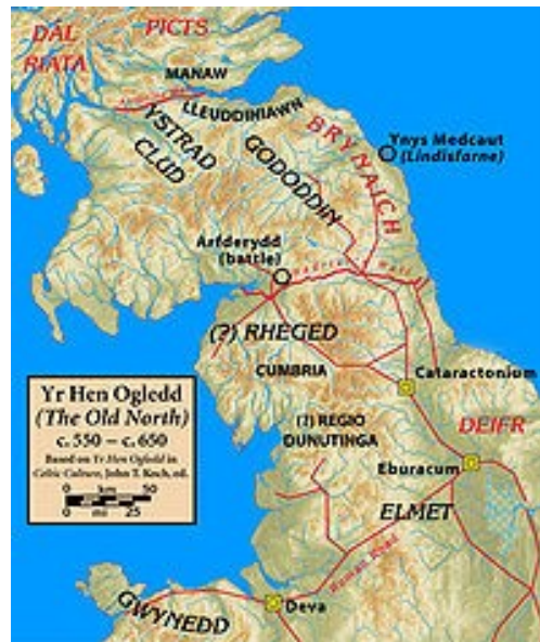
Illustration 2: Yr Hen Gogledd [https://en.wikipedia.org/wiki/Kingdom_of_Strathclyde]

Istor an tri den, anezho holl tudennoù faltaziet emichañs a c'hoarvez e-barzh ul lec'h hag un amzer bevennet mat : da lavaret eo ar c'hwec'hvet hag ar seizhvet kantved etre Breizh an hanternoz hag Iwerzhon. Un den arouez a vod an div vro : Áedán mac Gabráin †609 roue an Dál Riada e Skoz, kempred gant Rydderch Hael eus rouantelezh Strathclyde (Ystrad Clud war ar gartenn).