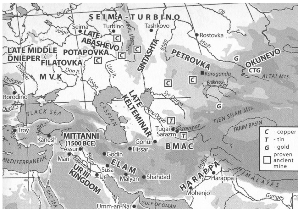
Illustration 1: Sevenadurioù ar stепенnoù hag Azia tro 2200 ha 1800 KHA [ANTHONY, p. 413 Figure 16.1]

Met n'eo ket echu gant gwezennad ar yezhoù da heul an arlakadenn yezh Indez-Europeg, rak Kent-Indez-Iraneg a zo da vezañ lakaet a-gent 2.000 KHA, ha Rag-Indez-Iraneg tro 2.500-2.300 KHA. Ur rannyezh eus Kent-Indez-Europeg n'eo ken. Diskouez a ra-hi e kultur Sintashta-Petrovka er reter war ar gartenn. Tro ar mare-se eo dispartiet an Indez-Europiz diouzh o c'havell kreisteiz Ukraina hiziv, ha merkañ war-un-dro dibenn ar prantad Kent-Indez-Europeg 27 .