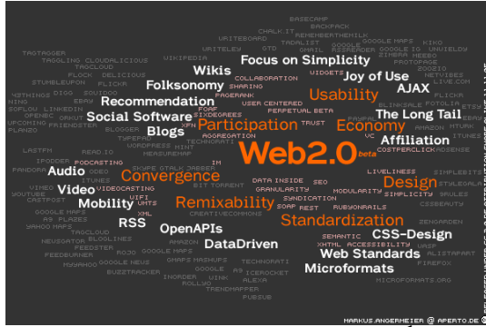
Figure 1. Exemple de Tag cloud 1

régulièrement collectées par un logiciel dédié installé sur l'ordinateur client et "poussées" à l'utilisateur en utilisant le format RSS.