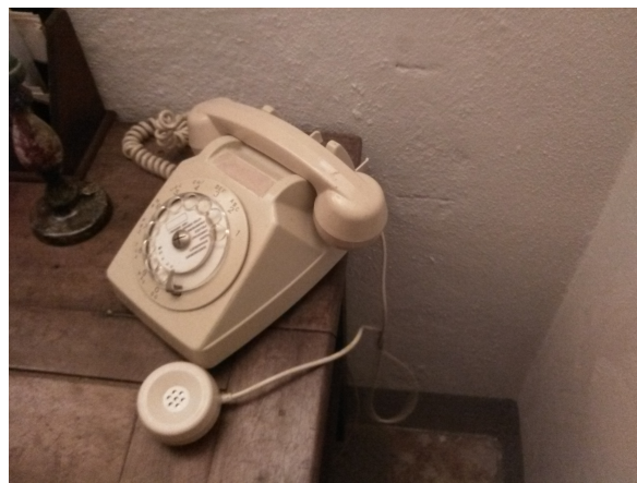
Figure 1 : Photographie du téléphone SOCOTEL 63

Aujourd'hui, presque tout le monde possède son propre téléphone portable. Il nous paraît presque inconcevable d'accéder au téléphone d'autrui, même à celui de son conjoint voir de ses enfants. Avant, le modèle de téléphone standard SOCOTEL S63, très largement distribué entre 1963 et 1985, en France, par les PTT, disposait d'un combiné et d'un deuxième haut-parleur pour permettre à deux personnes d'écouter une conversation. De plus, dans les maisons avec plusieurs téléphones branchés sur une même ligne, il était aisément possible d'écouter les conversations téléphoniques d'une pièce à l'autre.