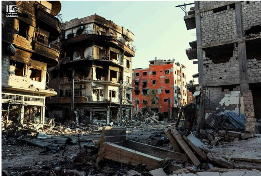
Photo 2 : Destrutions à Darayya, ville de la banlieue sud de Damas, le 19 janvier 2016

Dans les zones sous contrôle gouvernemental, les destructions sont inexistantes, comme dans la ville côtière de Tartous par exemple, éloignée des combats ; ou alors elles sont limitées, comme dans les quartiers centraux de Damas. Elles sont dans ce cas de figure le fait de tirs de roquettes et de mortiers tirés par des groupes armés de l'opposition, ou de bombes 19 . Elles affectent donc le tissu urbain de façon dispersée et ponctuelle. Ce sont les quartiers aux limites de ces zones qui sont davantage affectés.