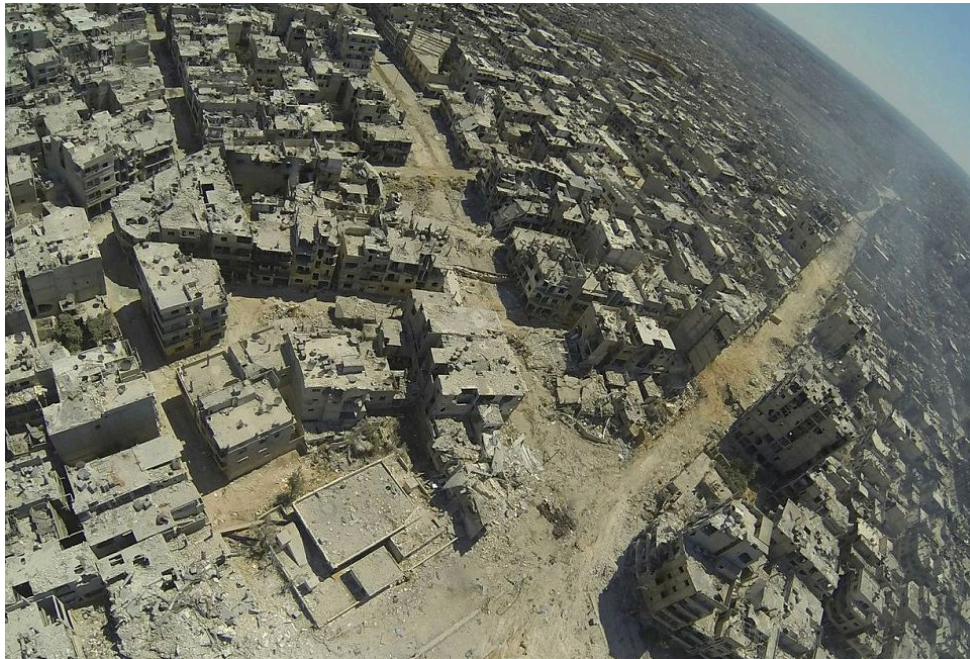
Photo 1 : Impacts des bombardements dans le quartier de Khaldiyyé à Homs en juillet 2013

côté à l'autre 18 . Enfin, le franchissement des lignes par les individus civils ou militaires contribue à garder une certaine porosité entre les zones. Celle-ci est cependant de plus en plus limitée au fur et à mesure que s'approfondit le conflit.