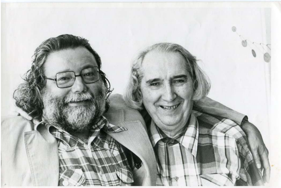
Pierre Restany et Mário Pedrosa.