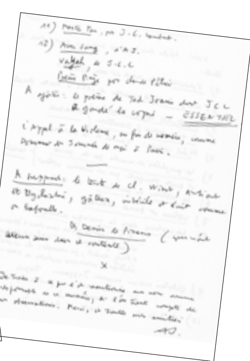
Notes by Alain Jouffroy, contents and comments about Opus International , no. 7, June 1968, fonds Alain Jouffroy [AJOUF.XG001/254]

But because of the strikes, the issue did not appear on the news-stands until June, just when the new general election was being prepared, when petrol was once again available in service stations, and the Sorbonne and the Odeon had ended up being evacuated.