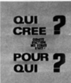
La 1 re affiche des Beaux-Arts : elle illustre l'inquiétude face à l'avenir.