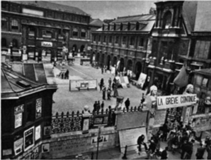
JUNI à SEUL LA POLICE LA FAIRE STATION, À BORD DES BEAUX-ARTS, À JOUR, À SEUL EN « ANCIEN POPULAIRE ». Les élèves qui l'occupaient l'avaient transformée en usine d'affiches, et sont sur de venir petits chefs-d'œuvre.