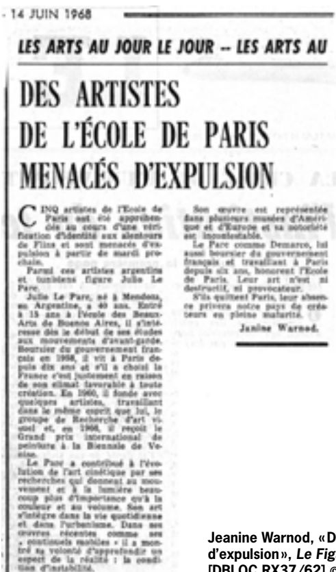
Jeanine Warnod, « Des artistes de l'École de Paris menacés d'expulsion », Le Figaro , 14 juin 1968, fonds Dany Bloch [DBLOC.RX37/62] © Jeanine Warnod

18. Jouffroy, Alain. « L'Aventure 1967-68/1978 », Opus International , n°66-67, printemps 1978, p. 14