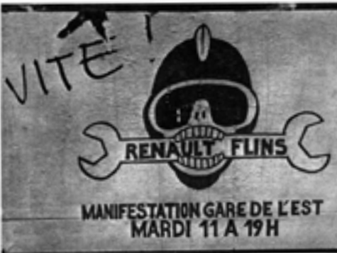
La vague de syndicalisme ouvrier, les grèves et les incidents entre les foyers de l'acier et les ouvriers de l'automobile en particulier ont inspiré, entre autres, ces quatre affiches fort éloignées, autant de « coups de poing » égarés...