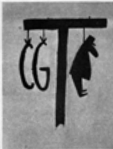
Les dévils entre la C.G.T. et le Pouvoir : un thème-choc de mois de mai.