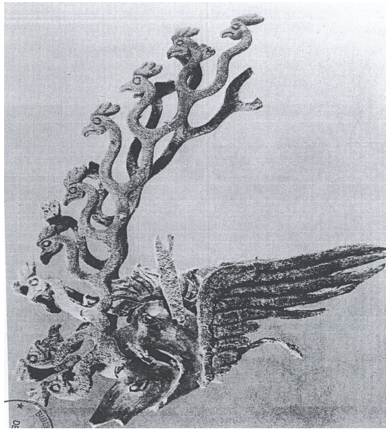
Skeudenn 3: Horse headdress from Pazyryk Cairn n°1. After Gryaznov, 1950 (Esther JACOBSON, The stag with bird-headed antler tines, Pl. 4 in The Museum of Far Eastern Antiquities, n° 56. Östasiatiska Museet: Stockholm, 1984.

Gwelet hon eus ne oa ket gouest ar Gelt da nijal en hengoun pobl. Met aze, er rannbennad 40 daoust hag eñ n'eo ket deuet Suibhne da vezañ Fer Benn, hag hennezh eo a vefe deuet gouest da nijal gant e spered a lavarfen? «Mantell ar varzhed pe gwelourien Iwerzhon, graet dre vras gant pluñv evned, a gouna gwiskamant ar Siberianiz, a zo peurliesañ o aroueziañ un evned bennak, pe rouesoc'h, ul loen.» 18 Aze marteze e kavomp an anadenn arkeologel a rae diouer deomp evit paveziñ an hent etre Evenked Sibiria hag ar Gelted?