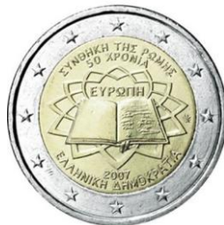
euro grec, mars 2007

De fait: qu'est devenu le symbole de l'anneau d'étoiles qu'est l'euro à l'heure du Brexit, 60 ans exactement après la signature du traité de Rome?