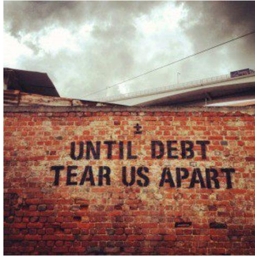
Lisbonne, LX Factory

“Être ou ne pas être ( en dette )” : la citation-titre vaut déjà comme une reconnaissance de dette; mais puisqu’elle est de Shakespeare, la citation est du “domaine public” : empruntée à taux zéro. Il n’y a rien à rembourser. Qui plus est, elle est empruntée à une pièce qui raconte une sombre histoire de compte à régler dans le royaume pourri du Danemark: une histoire de la dette insolvable et de l’usure du sang, aux marges de l’Europe, et sur fond de philosophie morale et politique ; une histoire dont toutes les disciplines – de l’art, de la pensée, de la psyché, de la morale, de la société – se sont emparées, à un moment ou un autre.