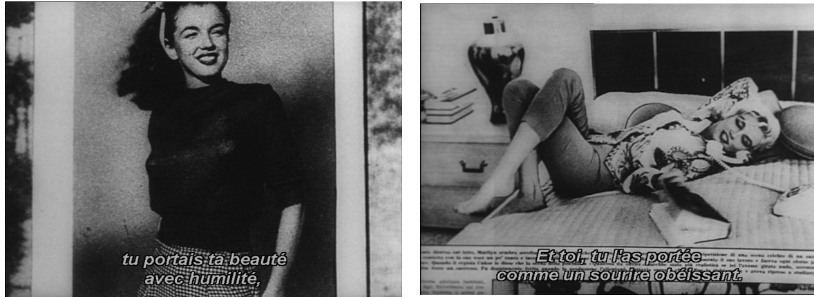
Ill. 5 et 6 : La Rage (Pier Paolo Pasolini, 1962)

Loin d'être obscènes, ces mouvements de caméra traduisent au contraire la volonté souveraine d'un regard qui n'entend pas laisser le dernier mot aux images. Si ces dernières, originellement, avaient pour fonction de dénuder Marilyn (symboliquement, si ce n'est littéralement), le regard de Pasolini, lui, la vêt, la pare, au même titre que le texte, d'une dignité que le cinéma, in extremis , reconquiert pour elle 23 .