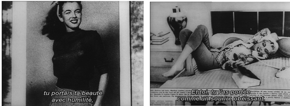
Ill. 5 et 6 : La Rage (Pier Paolo Pasolini, 1962)

Loin d'être obscènes, ces mouvements de caméra traduisent au contraire la volonté souveraine d'un regard qui n'entend pas laisser le dernier mot aux images. Si ces dernières, originellement, avaient pour fonction de dénuder Marilyn (symboliquement, si ce n'est littéralement), le regard de Pasolini, lui, la vêt, la pare, au même titre que le texte, d'une dignité que le cinéma, in extremis , reconquiert pour elle 23 .