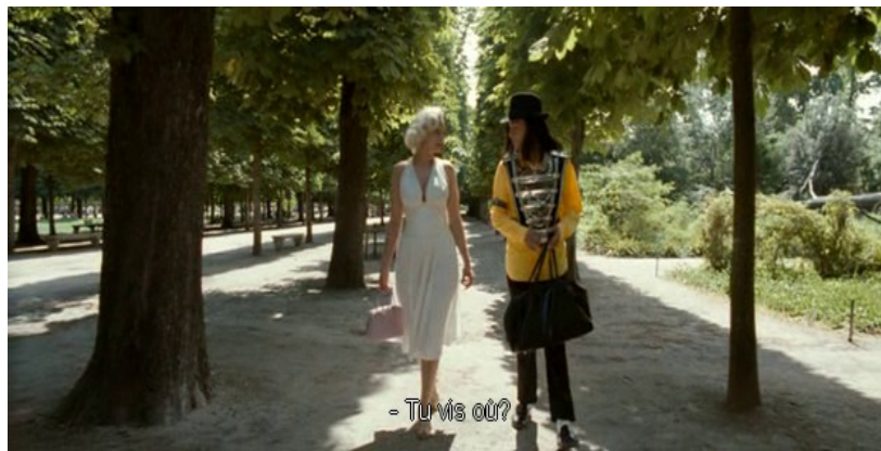
Ill. 4 : Mister Lonely (Harmony Korine, 2007)

quotidien. Ce n'est qu'en un second temps qu'apparaîtront des fêlures sur les masques qu'ils se sont choisis, et que la problématique réelle du film se désignera pour ce qu'elle est : non celle de l'imitation, mais du travestissement, qui rend douloureux l'écart entre personne et personnage dès lors qu'il n'est plus question de jouer ce dernier, mais de l'être, à plein temps et au détriment de soi. À la différence du film de Nicolas Roeg, qui demandait implicitement au spectateur d'accepter la réalité de la rencontre paradoxale mais pas totalement improbable de Marilyn Monroe et Albert Einstein, celui de Korine use du travestissement pour autoriser des rencontres parfaitement anachroniques, sur un mode quasiment burlesque qui transpose dans la fiction la légende populaire d'une île où vivraient en secret des célébrités lassées de leur commerce avec le Monde 17 . Ainsi Marilyn Monroe n'y figure plus un inaccessible objet du désir, mais une mère et une épouse, aimante et simple, n'était son accoutrement identique à celui d' Une Nuit de réflexion .