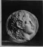
Alexander the Great From 6 Different Medals.