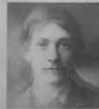
From 6 Members of same Family Male & Female.