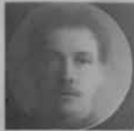
23 Cases. Royal Engineers, 12 Officers, 11 Privates