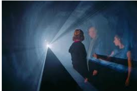
Image 1 Line Describing a Cone

met environ trente minutes à se former; mais surtout, il voit se matérialiser peu à peu – grâce à la diffusion au préalable de fumée artificielle – le cône de projection lui-même, autour duquel il est invité à tourner, à y plonger la main, et à observer à sa surface les volutes qui transforment l'impalpable lumière projetée en une sculpture visuelle aux effets de matière stupéfiants. Ainsi, ce ne sont pas les mondes représentés, les mondes imités, mais "les mondes imaginés [qui] déterminent de profondes communions de rêveries" (Bachelard 1989:21).