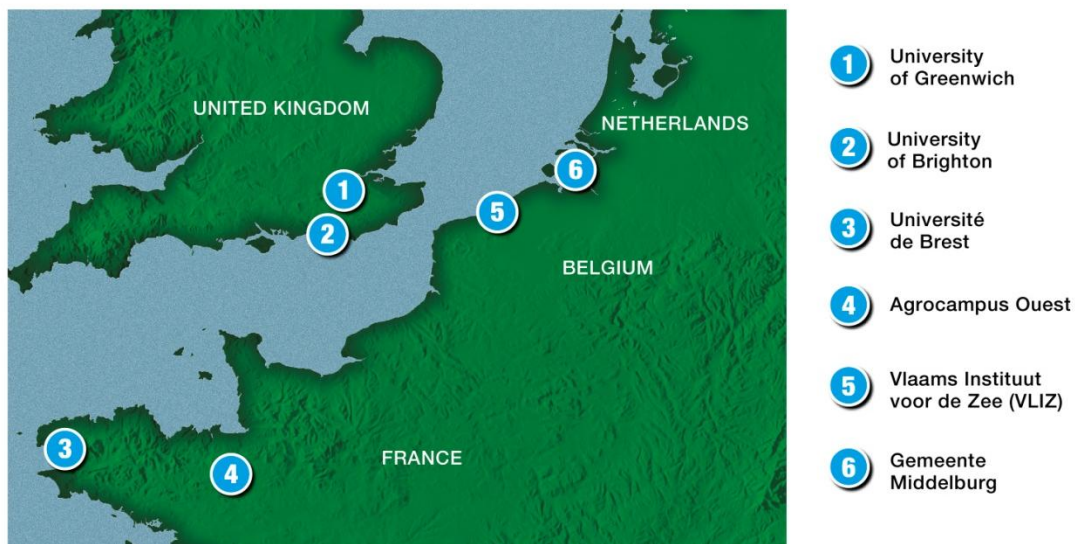
Localisation des différents partenaires du projet

Les travaux du projet GIFS couvrent la Manche et le sud de la Mer du Nord en associant six partenaires. Toutes les actions sont mises en œuvre de façon conjointe entre ces différents partenaires afin que le projet revête un véritable caractère transfrontalier.