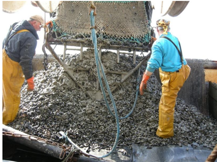
Figure 2 : Drague à moule

Les moules sont pêchées à la drague, dont les caractéristiques sont fixées par la réglementation locale. C'est un engin de pêche traîné sur le fond, utilisé pour la pêche des moules qui vivent posés ou plus ou moins enfouis dans les sédiments. Elle est constituée d'une armature sur laquelle est fixée une poche en filet et d'une barre inférieure ( Figure 2 ). Le filet est protégé sur le dessous par de grandes bandes de caoutchouc. . Une seule drague est autorisée à bord des navires. Quand la saison des moules est terminée, les navires exercent tous un autre métier, pour la plupart il s'agit de la drague à coquilles Saint-Jacques et du chalut (Montfort et Tesson, 2006).