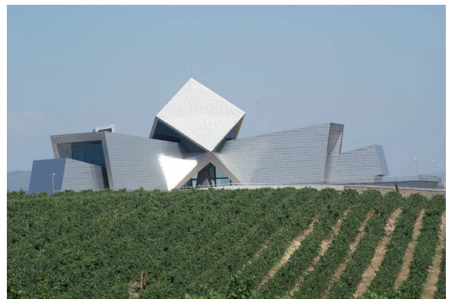
Figure 4 : la bodega Ysios dans la Rioja Alavesa (Espagne)