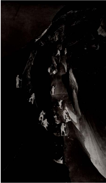
Fig. 9. L. et A. Bisson, « Savoie 44. La crevasse sur le chemin du Grand plateau », tirage sur papier albuminé d'après un négatif sur verre au collodion humide, 22,8 x 38,7 cm, 1862, coll. SFP.

voir dans une suspension du temps dont on sent bien qu'elle est elle-même tout à fait fragile.