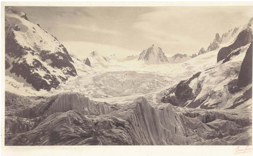
Fig. 8. L. et A. Bisson, « Séracs du géant. Chemin du jardin », tirage sur papier albuminé d'après un négatif sur verre au collodion humide, 23,2 x 39,8 cm, 1860, coll. SFP.

plutôt qu'à la relation, à la matérialité contingente de ce qui est plutôt qu'à la spiritualité harmonisée de ce qui devrait être.