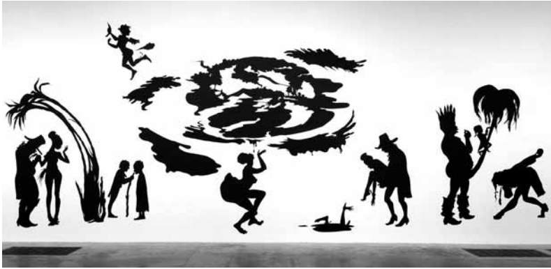
6. Kara Walker, Grub for Sharks: A Concession to the Negro Populace , Londres, Tate Modern, 2004.

l'affront de la dévirilisation en situation d'homme assujéti 19 . Cette réflexion n'est pas étrangère au remarquable travail de l'artiste Kara Walker sur l'esclavage (fig. 6) 20 .