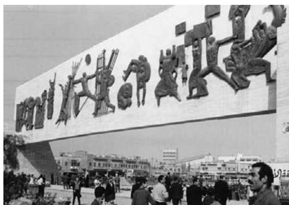
4. Jawad Saleem, Monument à la liberté , 1959, Bagdad, place Tahrir.

Le modèle d'empire qui s'est exercé en Inde, en l'occurrence celui de la Grande-Bretagne, s'est constitué pour servir une conquête. L'historien de l'art Éric Michaud, dont les travaux ne semblent pas a priori relever de la théorie postcoloniale, a remarquablement décrit comment l'art et sa discipline théorique ont participé, par l'exercice de rénovation de l'histoire de l'art, de la constitution du matériau symbolique de cette conquête. Porté à son point d'acmé, le génie d'un peuple – sa création, son art, vus comme tels, et son identité – ne peut que vouloir marquer sa durée nou-