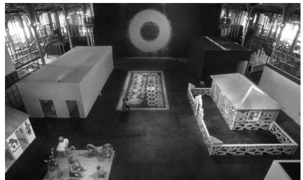
2. Vue de l'exposition Magiciens de la terre , Paris, Centre Georges Pompidou/La Grande Halle de la Villette, 1989.