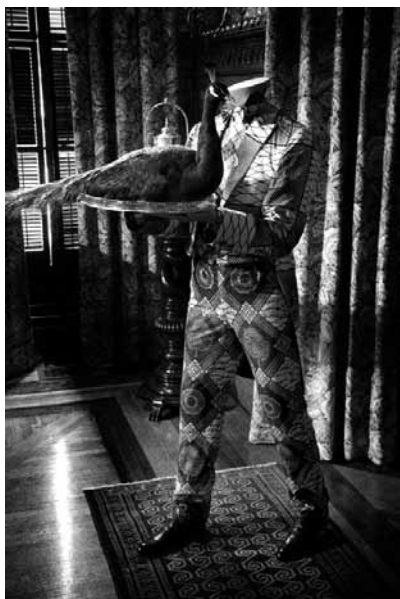
3. Yinka Shonibare, Party Time: Re-Imagine America (détail), 2009.

nant décisif dans les réflexions sur les rapports entre arts et pouvoirs. Le débat suscité par cette manifestation a provoqué une prise de conscience des enjeux politiques liés aux questions de représentation et a contribué à déconstruire l'idée d'une neutralité politique du modernisme en art. Aux États-Unis, une réflexion née dans le champ des études littéraires s'est alors étendue à celui de l'histoire de l'art et de la muséologie : les enjeux de pouvoir et de domination postcoloniaux furent pris en compte dans l'analyse des œuvres ainsi que dans les processus de monstration muséale. Primitivism in 20 th Century Art a constitué le paroxysme de la réappropriation formaliste des arts d'Afrique, des Amériques et d'Océanie, pris dans l'histoire longue de leur réception, et a marqué ainsi un véritable tournant (du moins aux États-Unis). Les vives critiques que l'événement a suscitées 5 ont participé d'un mouvement plus vaste de décentrement du regard induit par les études postmodernes et postcoloniales. Il devenait nécessaire, à l'époque, de donner la parole aux peuples opprimés, de les sortir de l'ombre dans laquelle l'Occident les avait longtemps maintenus.