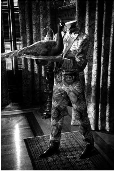
3. Yinka Shonibare, Party Time: Re-Imagine America (détail), 2009.

nant décisif dans les réflexions sur les rapports entre arts et pouvoirs. Le débat suscité par cette manifestation a provoqué une prise de conscience des enjeux politiques liés aux questions de représentation et a contribué à déconstruire l'idée d'une neutralité politique du modernisme en art. Aux États-Unis, une réflexion née dans le champ des études littéraires s'est alors étendue à celui de l'histoire de l'art et de la muséologie : les enjeux de pouvoir et de domination postcoloniaux furent pris en compte dans l'analyse des œuvres ainsi que dans les processus de monstration muséale. Primitivism in 20 th Century Art a constitué le paroxysme de la réappropriation formaliste des arts d'Afrique, des Amériques et d'Océanie, pris dans l'histoire longue de leur réception, et a marqué ainsi un véritable tournant (du moins aux États-Unis). Les vives critiques que l'événement a suscitées 5 ont participé d'un mouvement plus vaste de décentrement du regard induit par les études postmodernes et postcoloniales. Il devenait nécessaire, à l'époque, de donner la parole aux peuples opprimés, de les sortir de l'ombre dans laquelle l'Occident les avait longtemps maintenus.