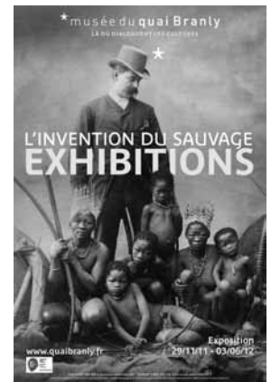
7. Affiche de l'exposition Exhibitions : l'invention du sauvage , Paris, Musée du quai Branly, 2011-2012.