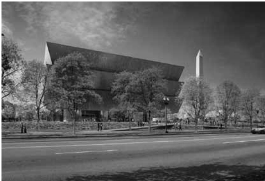
9. David Adjaye, Philip Freelon, maquette du National Museum of African American History and Culture au National Mall à Washington, D.C., ouverture du musée prévue en 2015.

Aussi louables que soient ces projets, ils n'en posent pas moins la question de la légitimité de la parole. Au National Museum of the American Indian, par exemple, n'est entendue que celle des Indiens, comme si le fait d'être Indien conférait une plus grande légitimité au contenu énoncé. Le critère identitaire semble parfois l'emporter sur la pertinence du propos. Tout se passe comme si les rapports de pouvoir s'étaient renversés sur un plan symbolique, de l'ordre du postulat éthique, et non sur un plan réel. Nous sommes loin du désordre introduit dans les années 1970 et vivons aujourd'hui une forme de sclérose de la pensée qui semble parfois privilégier (symboliquement) la voix des opprimés par rapport à la polyphonie et au dialogue.