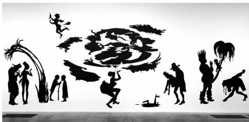
6. Kara Walker, Grub for Sharks: A Concession to the Negro Populace , Londres, Tate Modern, 2004.

l'affront de la dévirilisation en situation d'homme assujéti 19 . Cette réflexion n'est pas étrangère au remarquable travail de l'artiste Kara Walker sur l'esclavage (fig. 6) 20 .