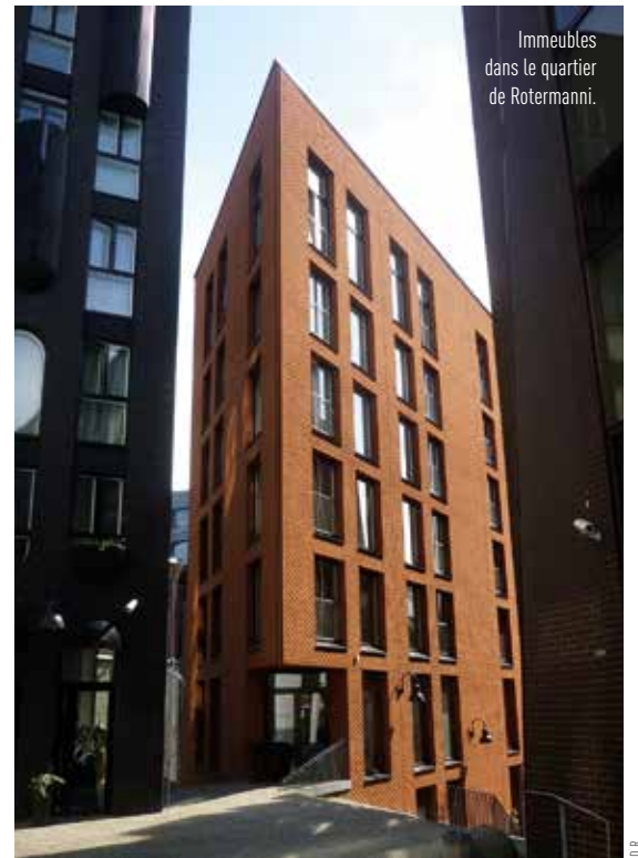
Immeubles dans le quartier de Rotermanni.

Le plus frappant est la façon dont le libéralisme s'est imposé dans l'urbanisme, au point de compliquer le maintien d'une cohérence d'ensemble, d'autant que