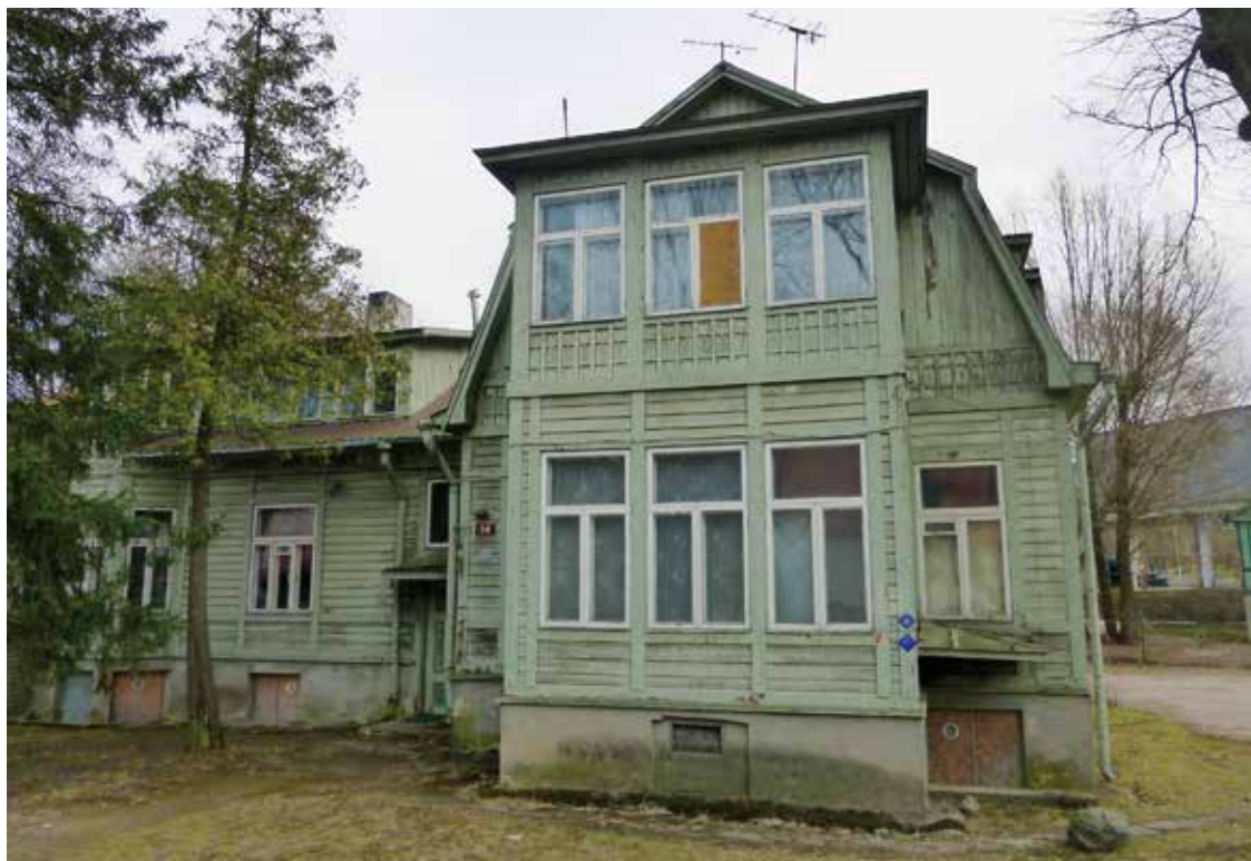
Les maisons de bois de Kadriorg, l'ancien quartier aristocratique de Pierre le Grand.

On est ainsi passé d'un contrôle public du foncier quasi absolu à une propriété entièrement privée.