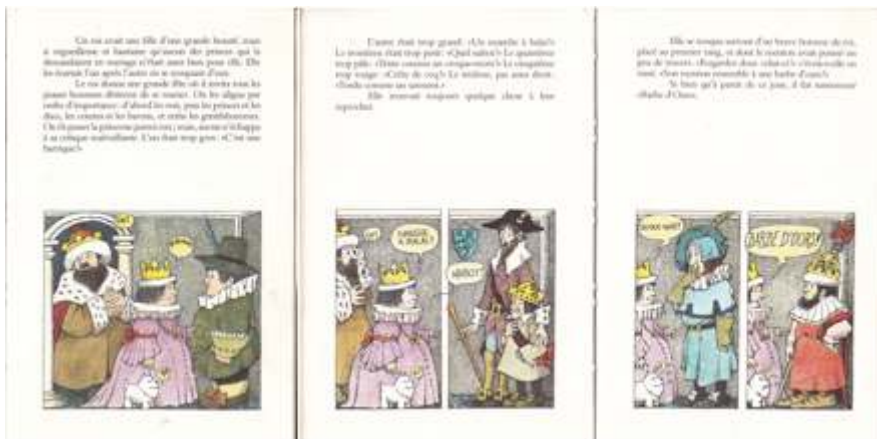
M. Sendak, Le Roi Barbe d'ours , L'École des loisirs, 1974.