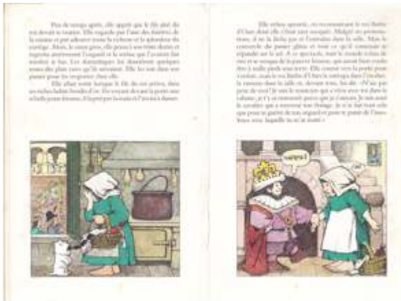
M. Sendak, Le Roi Barbe d'ours , L'École des loisirs, 1974.