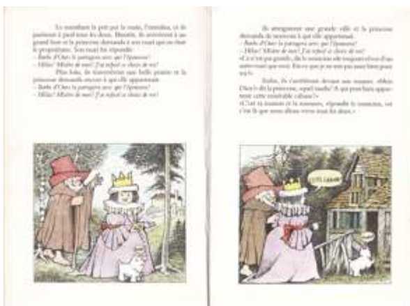
M. Sendak, Le Roi Barbe d'ours , L'École des loisirs, 1974.