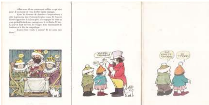
M. Sendak, Le Roi Barbe d'ours , L'École des loisirs, 1974.