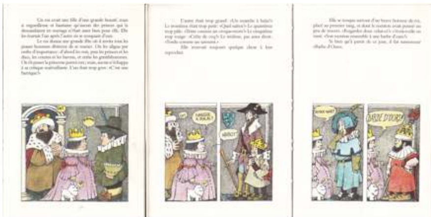
M. Sendak, Le Roi Barbe d'ours , L'École des loisirs, 1974.