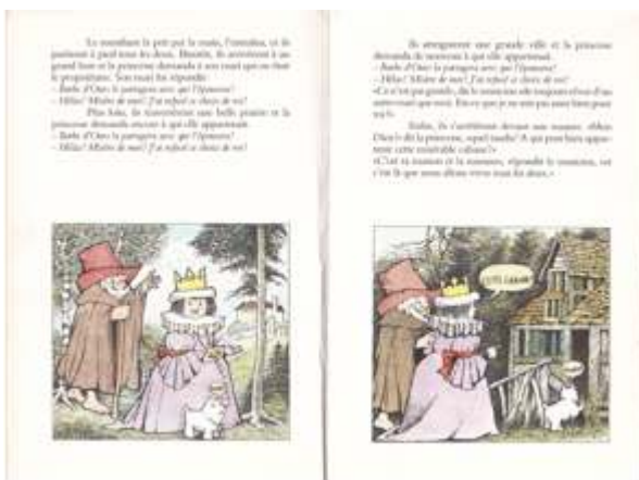
M. Sendak, Le Roi Barbe d'ours , L'École des loisirs, 1974.