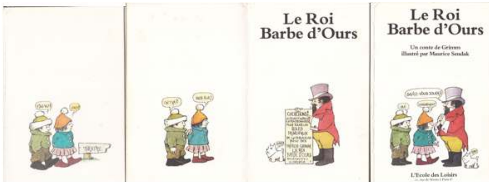
M. Sendak, Le Roi Barbe d'ours , L'École des loisirs, 1974.