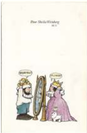
M. Sendak, Le Roi Barbe d'ours , L'École des loisirs, 1974.