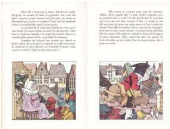
M. Sendak, Le Roi Barbe d'ours , L'École des loisirs, 1974.