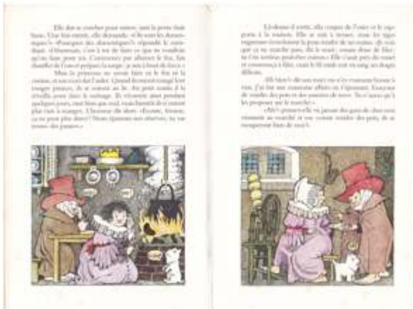
M. Sendak, Le Roi Barbe d'ours , L'École des loisirs, 1974.