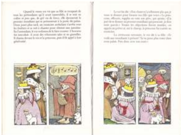
M. Sendak, Le Roi Barbe d'ours , L'École des loisirs, 1974.