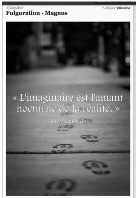
Illustration 1 : Extrait de page du blogue i-voix ( http://i-voix.net )

des blogueurs. On constate par exemple, dans la publication de Valentine du 17 juin 2016 (voir illustration 1), une association texte/image collaborative non figurative.