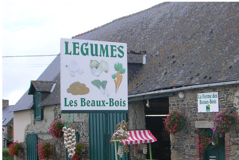
Une exploitation en vente directe