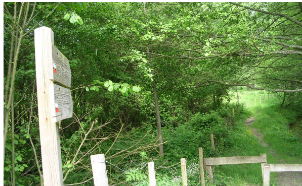
Chemin balisé