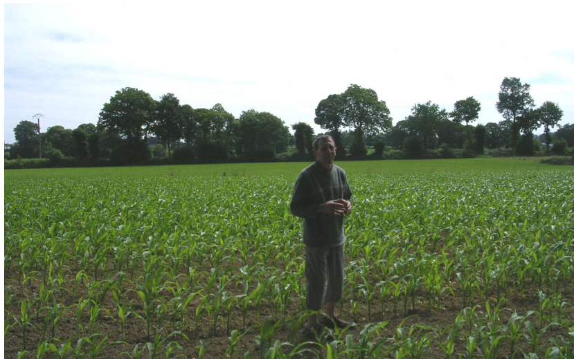
Un agriculteur dans son champ de maïs bordé de talus

Dans mes recherches, un problème concret est posé par le terme « paysage ». Fondamental en géographie, ce terme met en difficulté les agriculteurs car ils ne perçoivent pas comme tel leur exploitation et l'espace agricole en général. Au lieu de leur demander : « le paysage qui entoure votre maison vous semble-t-il (très beau, beau... laid) ? », ce qui les oblige à une évaluation esthétique urbaine, j'aurais dû leur demander « aux alentours de votre maison estimez-vous qu'il y a (trop peu, assez peu... beaucoup trop) de talus ? » car le