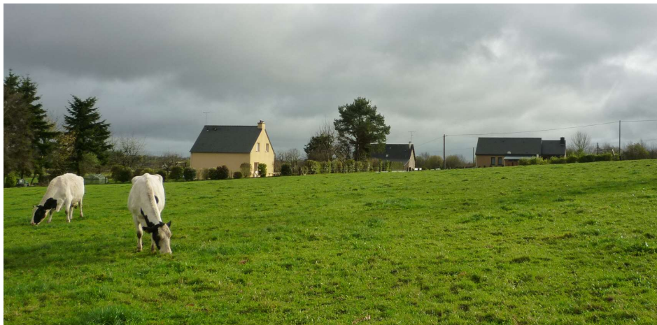
Maison neuve auprès des vaches

Exemple : tensions autour du foncier agricole