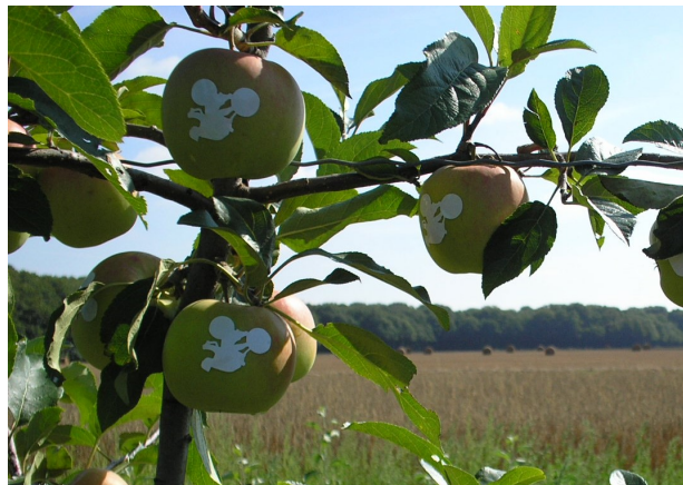
Pommes à vélos © Brice Sénéca