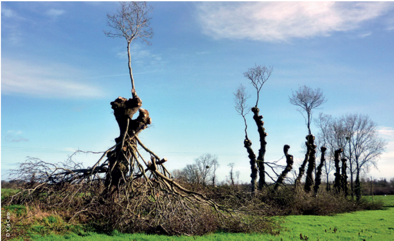
▲ La taille en ragosses, caractéristique du Pays de Rennes.

difficilement compatibles entre elles. Or les différentes fonctions ne sont pas toujours portées par un seul et même acteur. Là où le zonage conduit au « chacun chez soi » (même si des interactions existent entre les zones), la multifonctionnalité exige la régulation au quotidien des relations entre diverses parties prenantes. Et lorsqu'un même acteur pilote deux fonctions, par exemple pour une agricultrice la production de céréales et l'entretien de la biodiversité d'une haie, cela l'oblige à élaborer des solutions d'arbitrages, même lorsque les fonctions en cause ne sont pas antagonistes mais complémentaires.